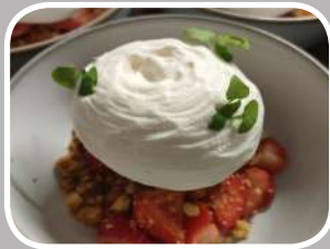
Menu du jour Entrée-Plat-Dessert Eaux-Café (midi)

Notre Chef vous proposera une cuisine élaborée à base de produits frais, locaux et de saison, il apportera sa touche créative qui saura ravir vos papilles.