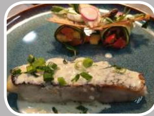
Menu du Chef Entrée-Plat-Dessert Eaux-Café (soir)