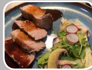
Menu Prestige Entrée-Plat-Dessert - Eaux-Café (soir)