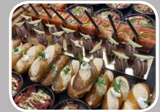
Cocktails Pièces cocktail salées (chaudes et froides) et sucrées.